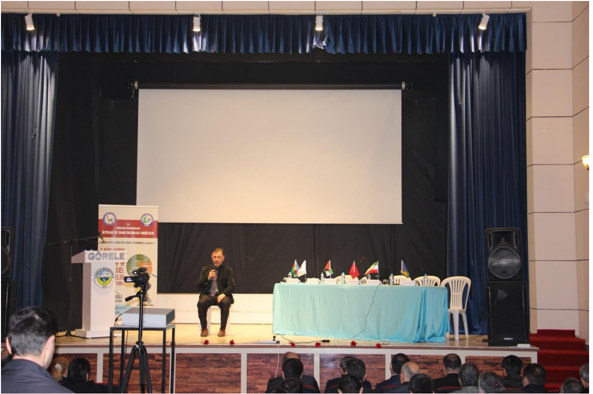
Şehitlerin Ruhuna Kuran-ı Kerim Tilaveti