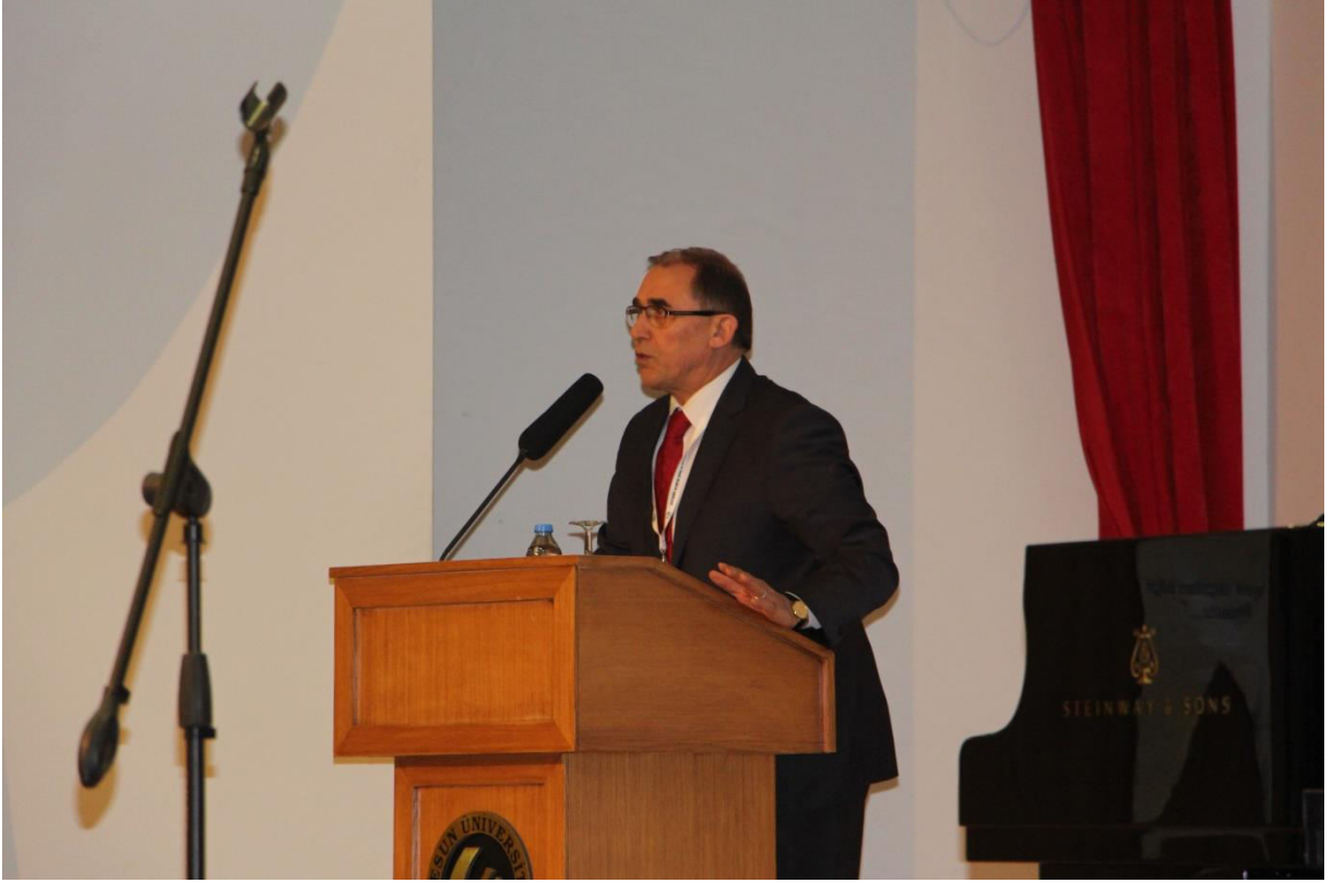
21. Dönem İçdir Milletvekili Abbas BOZYEL