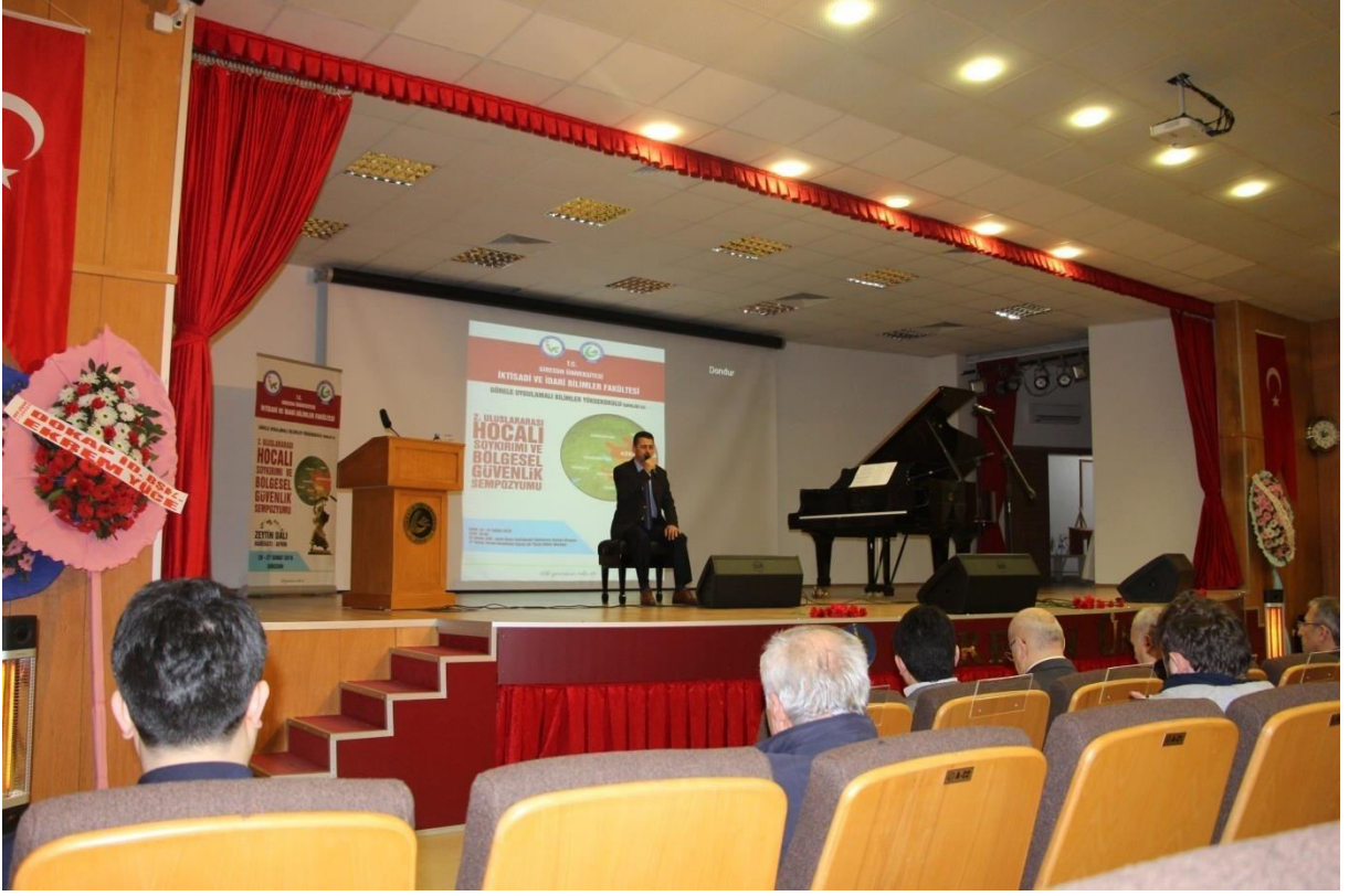
Şehitlerin Ruhuna Kuran'ı Kerim Tilaveti